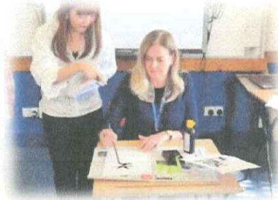
写真：書道の模擬授業の様子