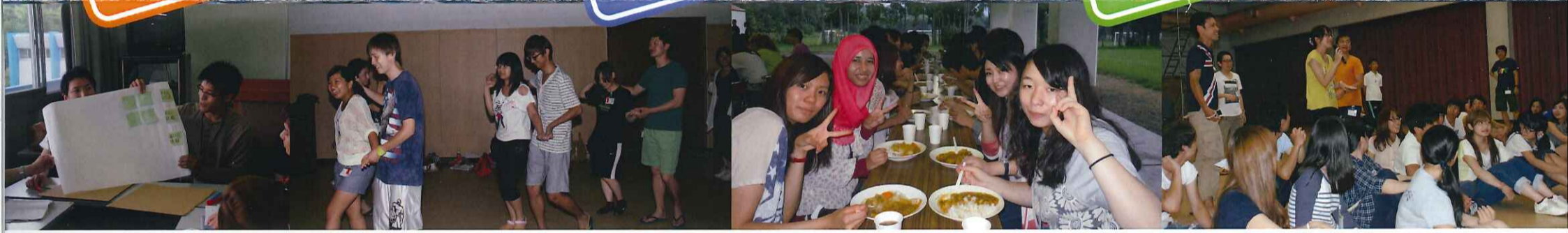
※カッター研修は平成26年度中国四国地区での様子です。実施しない地区もあります。